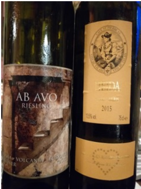
2015 Ab Avo Riesling, Vinea Volcania Ludovici

getrockneten Blüten und Heu, mineralischen Tönen, animierender, feiner Säure, sehr präzise dosierter Kraft und langem Abgang.