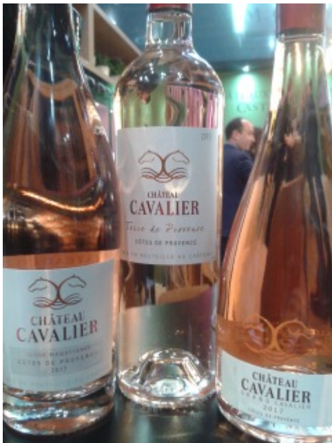
Perlen, Rosés und fliegende Flaschen

Nach meinem Besuch im Bordelais im vergangenen Jahr traf ich bei Castel Kommunikationsdirektor Franck Crouzet wieder, der mir die Neuheiten des Hauses vorstellte. Die Trends, mit denen sich Castel derzeit beschäftigt, sind Rosé und Schaumwein – und beide Weinarten bekam ich folgerichtig zum Probieren. Mein Favorit unter den Rosés war dabei der 2017 Grand Cavalier Côtes de Provence von Château Cavalier – kraftvoll, tief, mineralisch und animierend mit Aromen von dunklen Beeren. Aus der Languedoc-Rebsortenlinie verkostete ich davon abgesehen den 2017 Pinot Noir Grande Réserve – fein, saftig und ausgewogen.